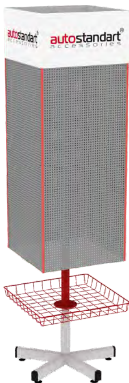
Вращающийся стенд с перфорированными поверхностями и крючками с ценникодержателями

оборудования вместе с продукцией ТМ AutoStandart. В настоящее время разработаны и созданы несколько конструкций такого оборудования: